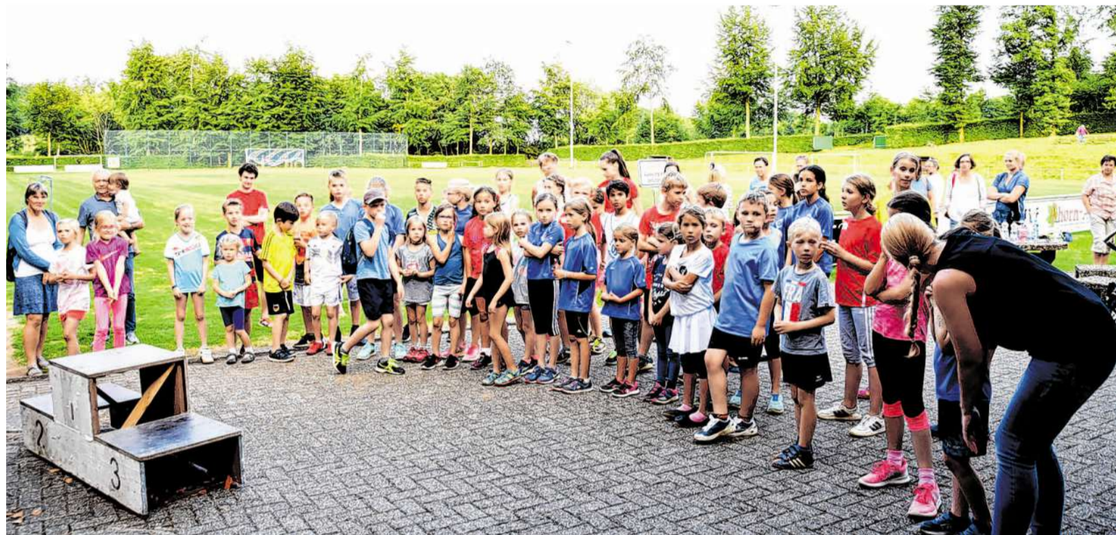
Konnten sich alle als Sieger fühlen: die Teilnehmer des 40. Schülersportfest des SV Germania Eicherscheid.