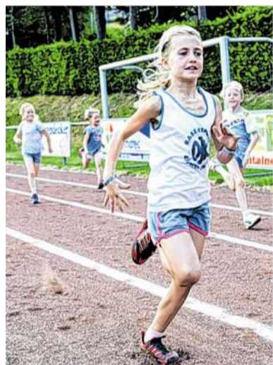
Die Kinder holten alles aus sich raus - auch in der Disziplin Laufen.